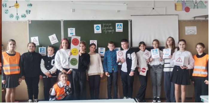
Члены отряда ЮИД «Зелёный свет» проводили тематические мероприятия о световозвращающих элементах, о дорожных знаках с учащимися начальной школы.